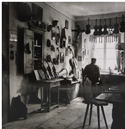
Erich Retzlaff, „Geigenbauerwerkstatt“, schwarz-weiß Fotografie, Zeiss-Ikon-Archiv 1950/60er Jahre

Weltmarktführer für Kameras, Zeiss-Ikon, in den 1960er und 1970er Jahren internationale bekannte Fotografen mit seinen Kameras aus, um das Weltgeschehen der damaligen Zeit einzufangen. Die Schwarz-Weiß-Silbergelatinenabzüge zeigen eindrucksvolle Portrait-, Landschafts- und Detailaufnahmen: Szenen des alltäglichen Lebens, fremde Länder, Mode, Sport, Tier- und Pflanzenwelten. Kunst & Kuriosa Auktionen in Heidelberg versteigert auf seiner 251. Auktion mehr als 100 Belegbilder, die von Zeiss-Ikon archiviert wurden. Unter den für die internationale Presse und Ausstellungen entstandenen Fotografien befindet sich auch die