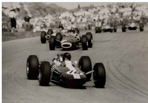
Rainer W. Schlegelmilch, Formel 1 Fahrer Jim Clark im Lotus, „Weltmeisterschaft 1963“, schwarz-weiß Fotografie, Zeiss-Ikon Archiv 1960er Jahre

Die Welt betrachtet durch eine Linse, eingefangen in höchst qualitativen Aufnahmen. Auf der Suche nach spannenden und seltenen Aufnahmen stattete der